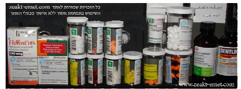
כמות התרופות שעמי צורך בקנדה (בהוראת הרופאים)